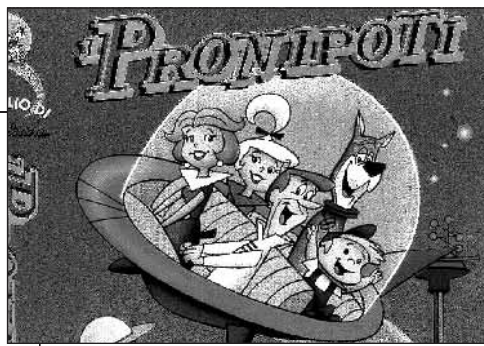
I PRONIPOTI. Auto volanti, una domestica robot e una serie di macchine improbabili per risparmiare fatica: chi immaginava il futuro negli Anni Sessanta si ispirava alla vita e alla casa dei Jetson, protagonisti del cartone animato americano i «Pronipoti».