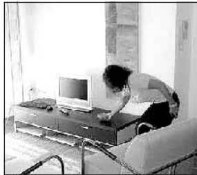
Faenza, la casa intelligente

Con la domotica, dunque, la casa è sempre a portata di mano. Un cellulare e un telefono e il telecomando diventa un reperto archeologico. Ma l'Italia, dove secondo alcune stime ben il novanta per cento degli appartamenti in cui attualmente vivono le «e-family» ha ancora un contatore elettrico da 3 kilowatt, è davvero pronta per questa ennesima rivoluzione tecnologica?