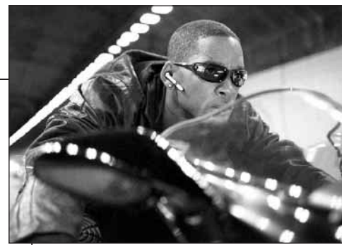
IO ROBOT. 2035: i robot sono diventati un normale elettrodomestico: in ogni casa ce n'è uno. Ma dopo la morte del loro inventore, il dottor Lanning, il detective Spooner inizia a indagare e scopre che i robot possono costituire una seria minaccia per la razza umana.